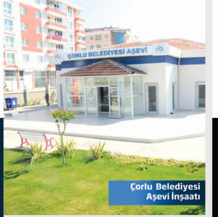
Çorlu Belediyesi Aşevi İnşaatı