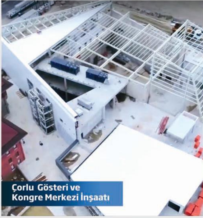
Çorlu Gösteri ve Kongre Merkezi İnşaatı