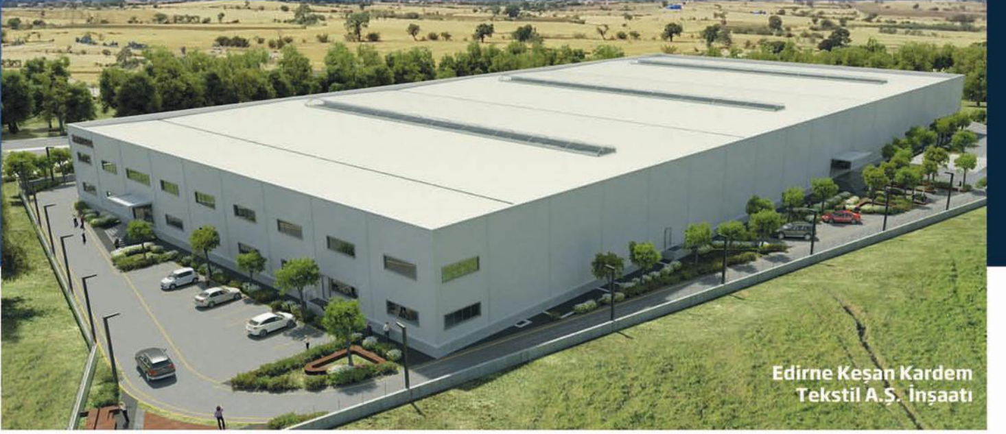
Edirne Keşan Kardem Tekstil A.Ş. İnşaatı